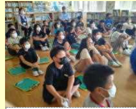
【お話を聞く真剣な表情】

夏休みを前にして、秋田臨港警察署の方を講師にお招きして情報モラル教室を実施しました。SNSを利用する際に気を付けること、やってはいけないことなどを学ぶことは『自分自身を守ること』だというお話に、真剣に聞き入っていました。オンラインゲームや情報通信アプリ等の利用に際して、お家の人と使い方の約束を決めることと、決めた約束を守ることがとても大事だそうです。最後のクイズ形式の振り返りでは、全員が学んだことをしっかりと理解できていました。