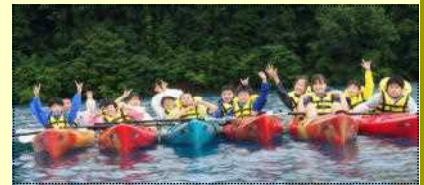
【田沢湖カヤック体験：湖面でパチリ】

ことができました。宿泊施設での過ごし方も大変立派で、一人も体調を崩すことなく花丸の修学旅行でした。この経験を基に、また一回り成長できることを確信した二日間でした。